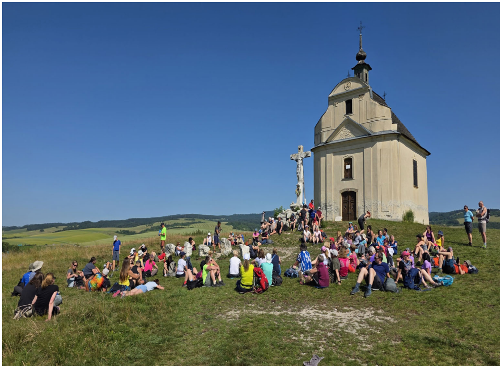
Kaplica Krzyża Świętego.

Na początek proponuję spacer ścieżką dydaktyczną Sivá Brada – Drevenik i dalej do miejscowości Žehra. Już na początku zobaczymy coś niezwykłego. Pokonując strome podejście wdrapiemy się na górujące nad okolicą wzgórze o wysokości 503 metry. Tak naprawdę jest to czwartorzędowy kopiec trawertynowy, który wciąż się buduje. Dlatego zobaczymy wiele regularnie pojawiających się wycieków wodnych. Niektóre z nich wydają jak gejzery tyle że woda w nich tryska ledwie na kilkadziesiąt centymetrów w górę.