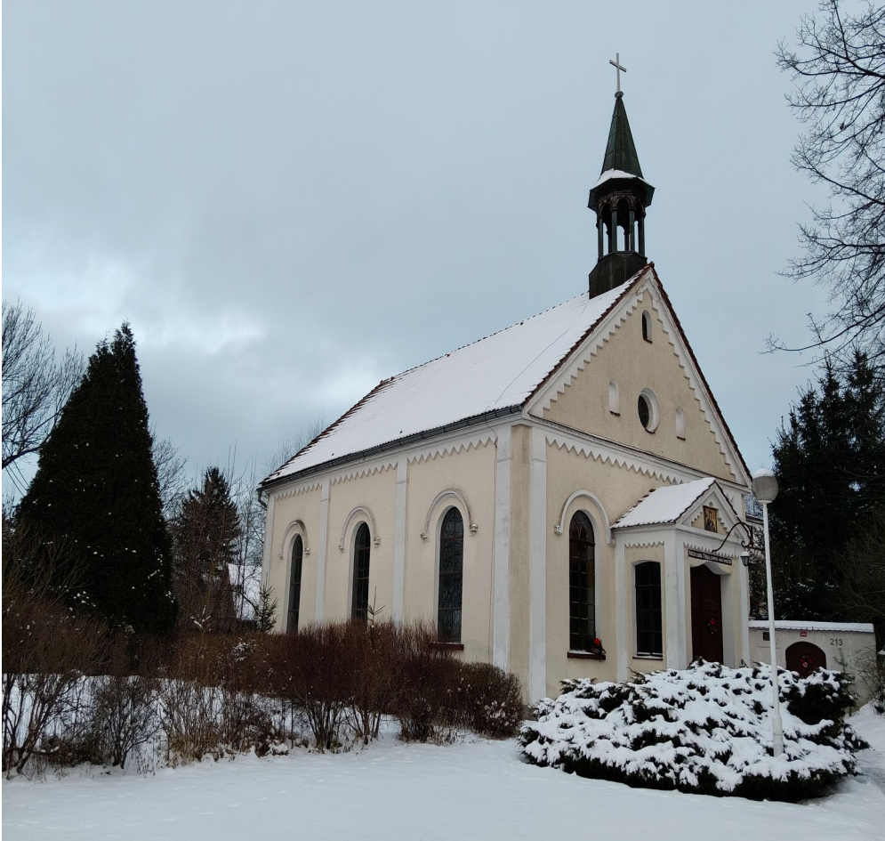
Kościół Polskokatolicki pw. Matki Bożej Nieustającej Pomocy w Jeleniej Górze Cieplicach.

Gdy po latach niewoli na mapach świata pojawiła się ponownie Polska, Polski Narodowy Kościół Katolicki zaczął zakładać parafie w Polsce. Pierwszą była parafia w Bażanówce (1921 rok). W sumie do 1939 roku w Polsce działało ponad 60 parafii PNKK. W okresie 1939-1945 (II wojna światowa) władze niemieckie groźbą likwidacji wymusiły zmianę nazwy na Polski Kościół Starokatolicki. Chodziło o podporządkowanie Kościoła pod Narodowy Kościół Rzeszy Niemieckiej. Niestety okres wojny to utrata wielu księży, którzy zginęli zarówno z rąk Niemców jak i Polaków.